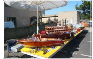
Photos : Fête des Associations 2009, et stand académie de Modélisme du CCAS d'Agde.