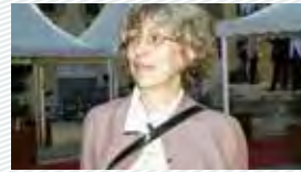
Mireille DARC , Georges LAUTNER , Président d'honneur Bernard BLIER