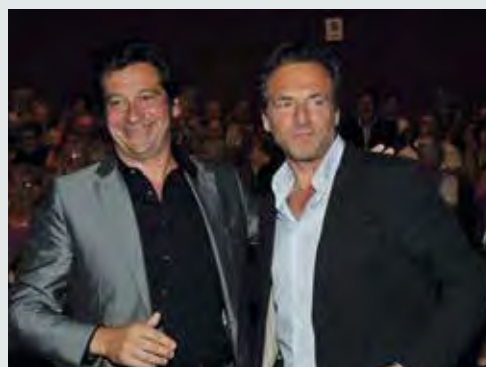
Page de gauche André Dussolier, Audrey Lamy et Richard Berry Shirley Bousquet, Zinedine Soualem et Audrey Lamy