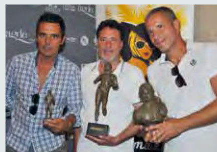
Page de gauche Le gang des Lyonnais d'Olivier Marchal Michael Lonsdale