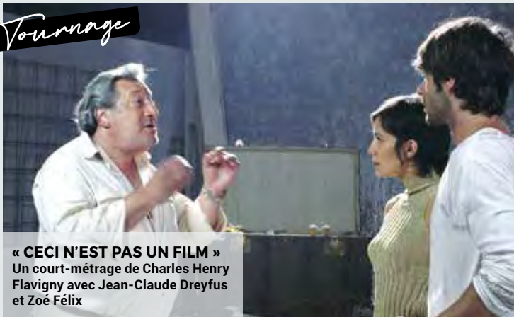
« CECI N'EST PAS UN FILM » Un court-métrage de Charles Henry Flavigny avec Jean-Claude Dreyfus et Zoé Félix