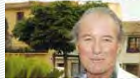
ANÉMONE Jean-Hugues ANGLADE Astrid VEILLON Jean-Claude DREYFUS Venantino VENANTINI Claude ZIDI