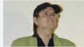
Zoé FÉLIX Christian VADIM Philippe LELLOUCHE Jean-Marie POIRÉ Vanessa DEMOUY Jean-Pierre MOCKY