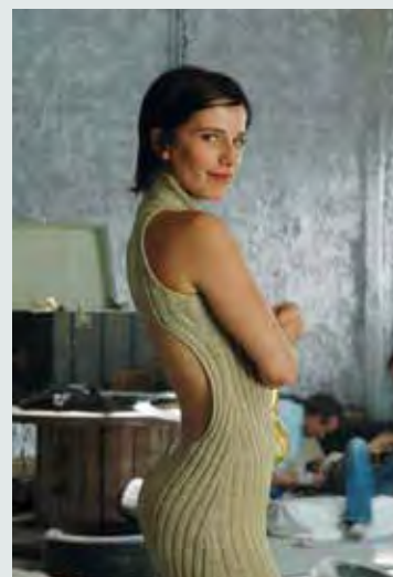
Page de gauche Georges Lautner et Mireille Darc, Bernard Blier, Jean-Hugues Anglade