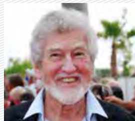
Vincent LAGAF Martin LAMOTTE Patrick PRÉJEAN Serge MOATI Cécile BOIS Charlotte VALANDREY Linda HARDY