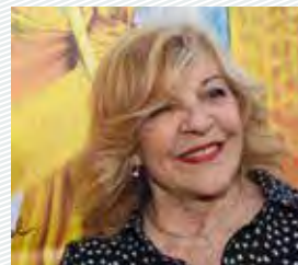
Richard BOHRINGER Gérard HERNANDEZ Jalil LESPERT Fanny COTTENÇON Danièle THOMPSON Hippolyte GIRARDOT NICOLETTA Déborah FRANÇOIS Bernard LE COQ Olivier SITRUK